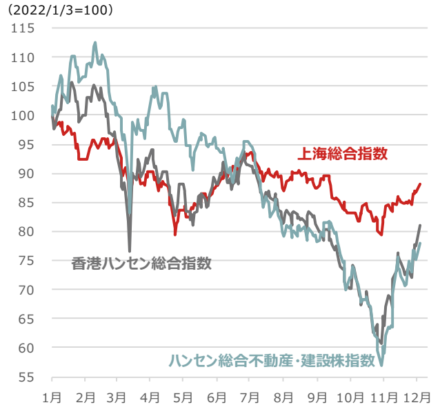
上海総合指数、香港ハンセン総合指数、ハンセン総合不動産・建設株指数

期間：2022年1月3日～2022年12月5日、日次