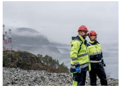
写真：北海送電線 建設地域

ノルウェー側では2016年より既に建設が開始され、英国側は今年から建設開始となる予定です。2021年までに操業開始の見込みで、1.4ギガワットの送電を計画しています。