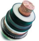
(ケーブルイメージ)