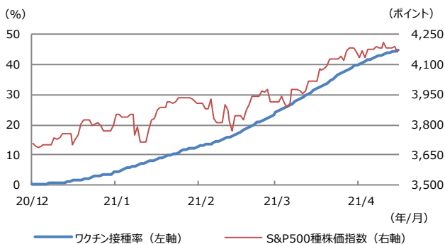
【図表1：米国のワクチン接種率と株価の推移】

(注) データは2020年12月20日から2021年5月4日。ワクチン接種率は少なくとも1回の接種を受けた人の総人口に占める割合。