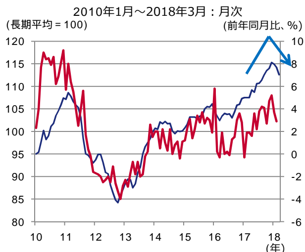
図表1 ユーロ圏の景況感と鉱工業生産

— 欧州委員会景況感指数（左軸） — 鉱工業生産（右軸） (注) 鉱工業生産は2018年2月まで