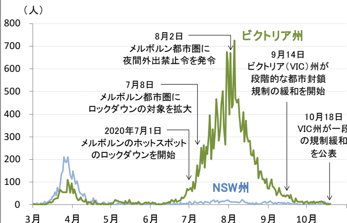
図1: 豪州のビクトリア州とNSW州の新型コロナウイルスの新規感染者数の推移

(期間) 2020年3月1日~10月19日 (注) NSW州はニューサウスウェールズ州。