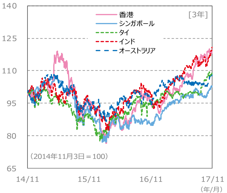
【国・地域別の株価指数の推移】