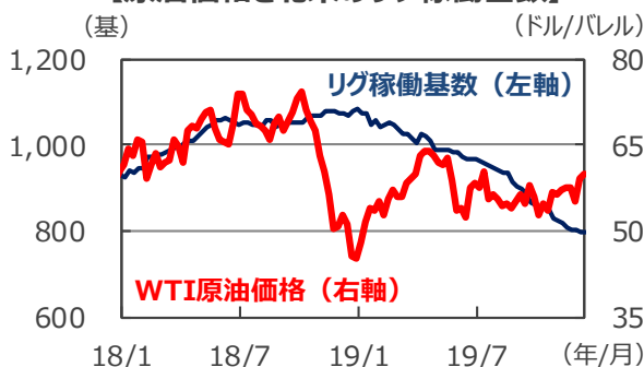
【原油価格と北米のリグ稼働基数】

(注) データは2018年1月5日～2019年12月13日。週次データ。WTIは原油価格の代表的な指標のひとつ。