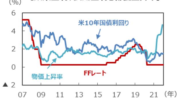
【政策金利、長期金利と物価上昇率】

（注1）FFレート、米10年国債利回りは2007年1月～2021年12月。2008年12月以降のFFレートは誘導レンジの上限を表示。 （注2）物価上昇率は個人消費支出（PCE）コア物価指数の前年同月比。2007年1月～2021年11月。