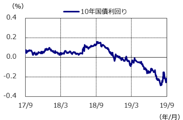
10年国債利回りの推移