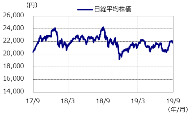
日経平均株価の推移