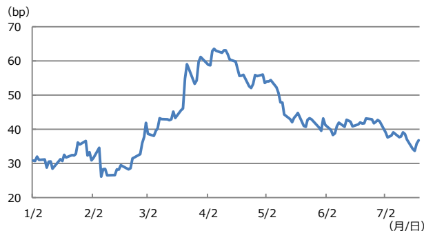
【図表2：TEDスプレッドの推移】