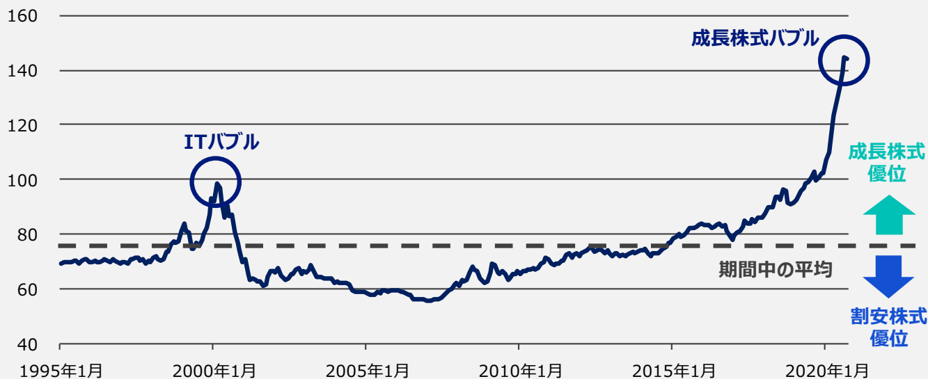
割安株式と成長株式の相対パフォーマンス*

* 割安株式と成長株式の相対パフォーマンスは、成長株式の株価を割安株式の株価で除し、100を乗じた値を使用しています。期間：1995年1月末～2020年9月末、月次。 割安株式はMSCIワールドバリュー株指数、成長株式はMSCIワールドグロース株指数（それぞれ米ドルベース、プライス・リターン）を使用。 上記は過去のデータであり、将来の成果を保証するものではありません。